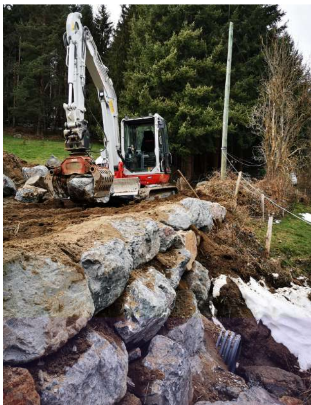
Travaux à la grange du bois

Les services techniques de notre commune réalisent des chantiers divers tout au long de l'année. Ils ont récemment effectués des travaux importants au cimetière, au rond roint des Mâts, à la piscine, à la grange du bois ou encore au chemin du cerisier. Voici des exemples de réalisations récentes.