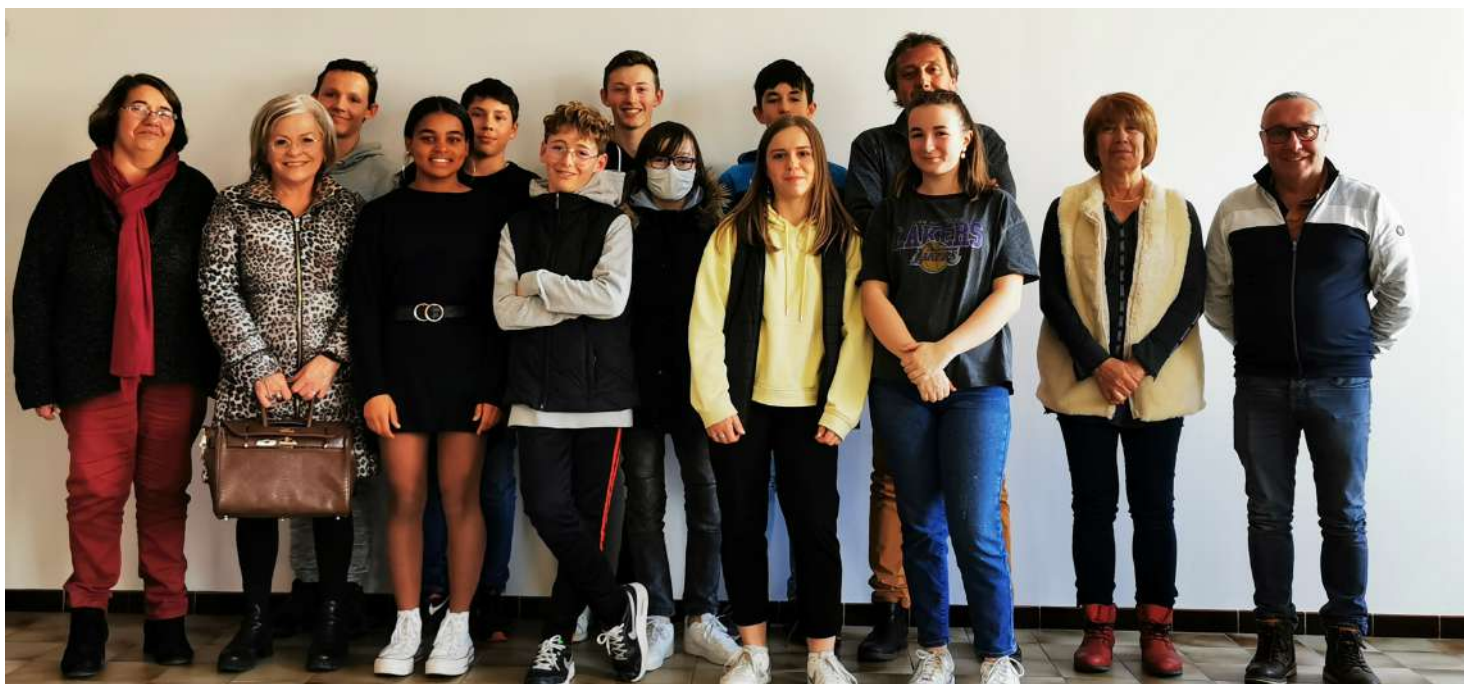
Le conseil municipal des jeunes, en mairie, le 8 avril