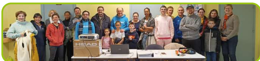
Assemblée générale du club, janvier 2024

Fort de ses 260 adhérents, le Tennis Club de Saint-Didier est le troisième club de Haute-Loire et le premier club de Loire-Semène.