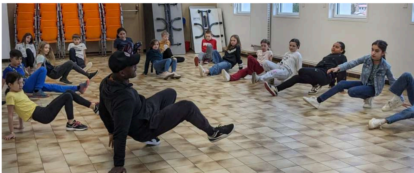
2024, année olympique : le breakdance, nouvelle discipline aux JO, s'invite à Saint-Didier, dans le cadre du Printemps des Couleurs.