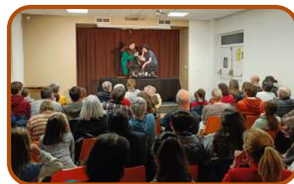
Théâtre, Mode d'Emploi, joué en mairie au mois de février

Grâce au partenariat entre la municipalité, le collège Roger Ruel et la Comédie de Saint-Étienne, un spectacle est organisé à Saint-Didier tous les ans. Cette année, deux comédiennes ont joué la pièce Théâtre, Mode d'Emploi dans la maison pour tous. Des spectacles retours à la Comédie de Saint-Étienne seront bientôt disponibles en mairie.