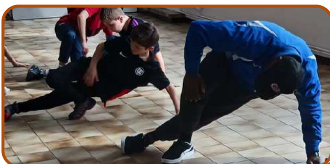
Atelier breakdance en mairie au mois de mars

La mairie met en avant une nouvelle discipline aux Jeux Olympiques de Paris : le breakdance.