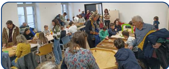
Animation jeu en bois organisée par le CCAS, vacances scolaires, février 2024