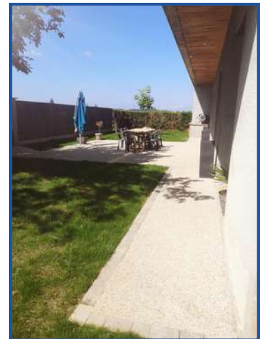
Un exemple de réalisation de terrasse à Saint-Didier