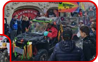
Le Retour de la 79 a gagné le concours de chars organisé par le GLAD