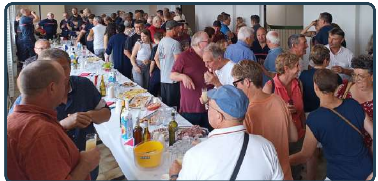
Temps de convivialité après la cérémonie