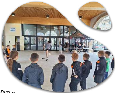
Animations de football freestyle en juin et en juillet