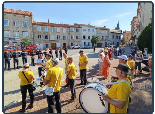
Une cérémonie réussie grâce à la fanfare