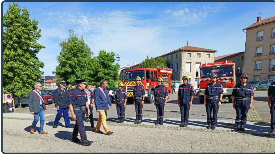
Passage en revue des troupes et du matériel