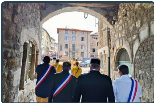
Cérémonie et défilé en présence des trois maires du 43140 et des forces de l'ordre