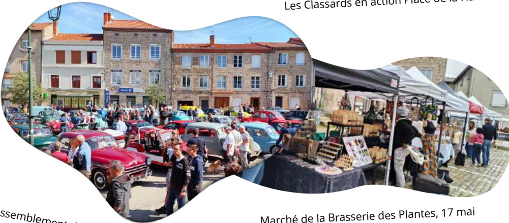
Marché de la Brasserie des Plantes, 17 mai