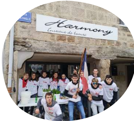
Les Classards en action Place de la Halle