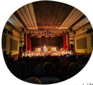
Spectacle de théâtre par les collégiens de Roger Ruel