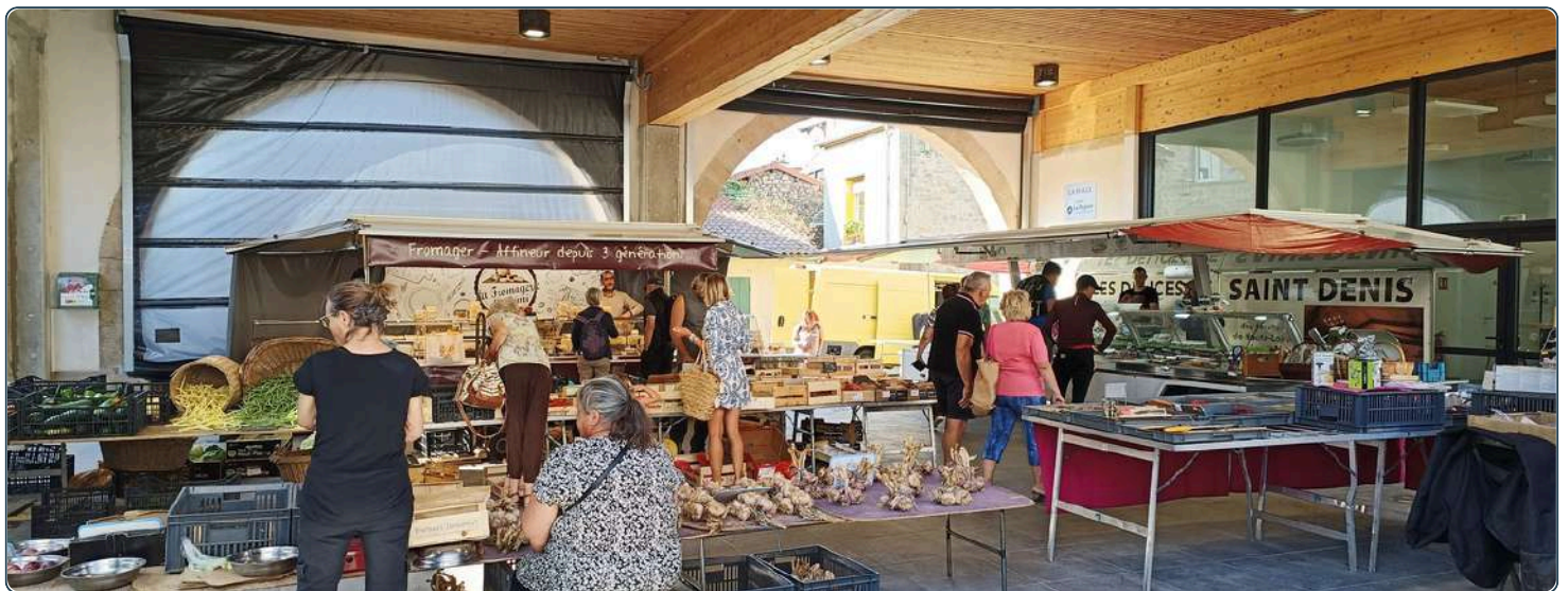
Le grand marché du mercredi