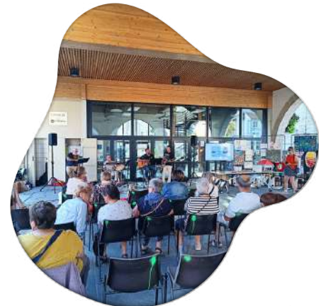
Concert avec The Meltic Frogs, marché animé du 30 août