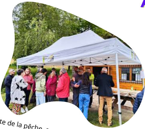
Fête de la pêche, organisée par l'AAPPMA

Retour en images sur quelques animations du printemps et de l'été