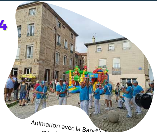
Animation avec la Band'à banda, marché animé du 5 juillet