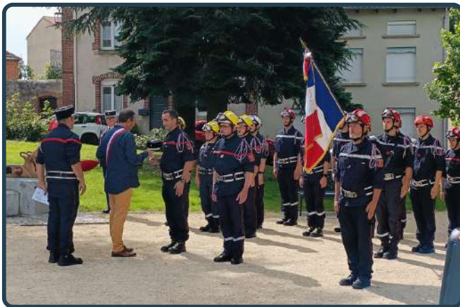
Remise de décorations par Monsieur le maire